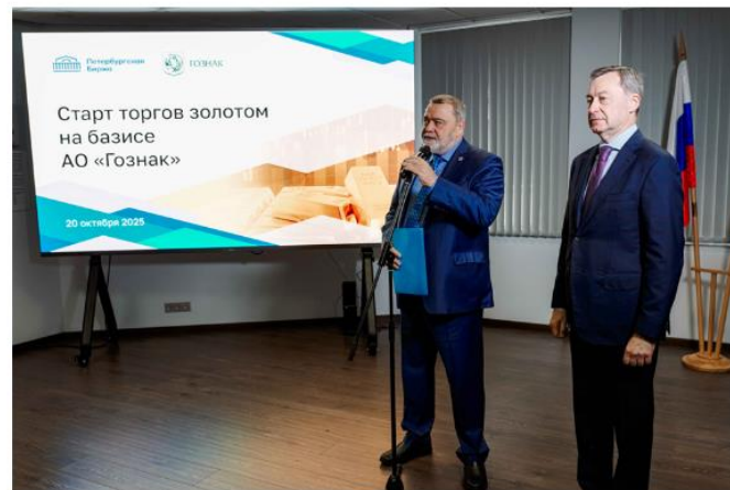
На фото: президент Биржи Игорь Артемьев и генеральный директор АО «Гознак» Архадий Трачук перед открытием торгов